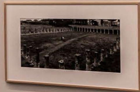
Capri, 1967 (2023)