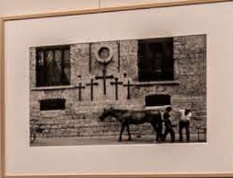
Capri, 1967 (2023)