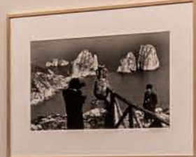
Capri, 1967 (2023)