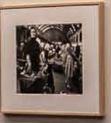
Capri, 1967 (2023)