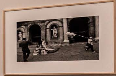
Capri, 1967 (2023)