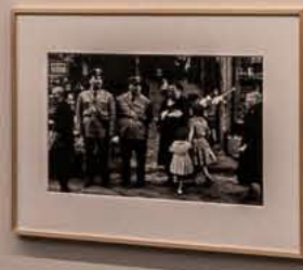
Capri, 1967 (2023)