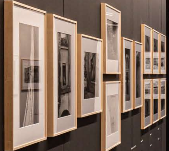
Spazio, Napoli, 1988